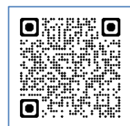
教材 Web サイト

特別支援学校の生徒が社会に出る前に身に着けるお金に関する知識・トラブルの未然防止の目的がとても明確な教材で、正しい消費生活を送るための、クイズによる選択があり、時間をとってしっかり考える工夫がされています。また、対象者だけでなく、その保護者向けにも理解してほしい内容をまとめた教材(動画)が用意されている点が評価されました。