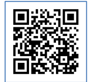
シンポジウム 開催概要ページ

シンポジウム URL https://www.consumer-education.jp/2026sympo/